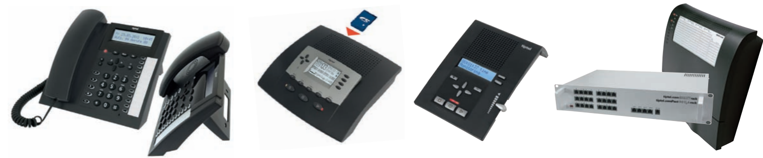
Von links nach rechts: tiptel 2020/2030, tiptel 570 SD, tiptel 333 und tiptel comPact 84 Up4