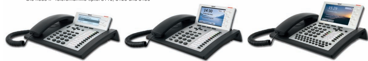
Die neue IP-Telefonfamilie tiptel 3110, 3120 und 3130

Ergophone GmbH, Marburg, Deutschland Entwicklung von ergonomischen Telefonen und Produkten für den Gesundheitsmarkt