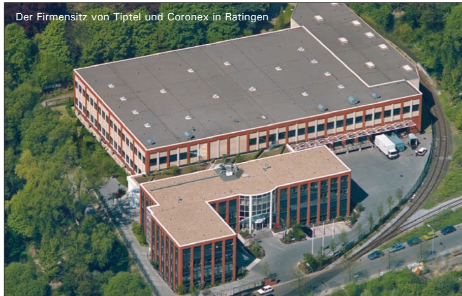
Der Firmensitz von Tiptel und Coronex in Ratingen

CET Quality Service Shenzhen Ltd., Shenzhen, China (PRC)