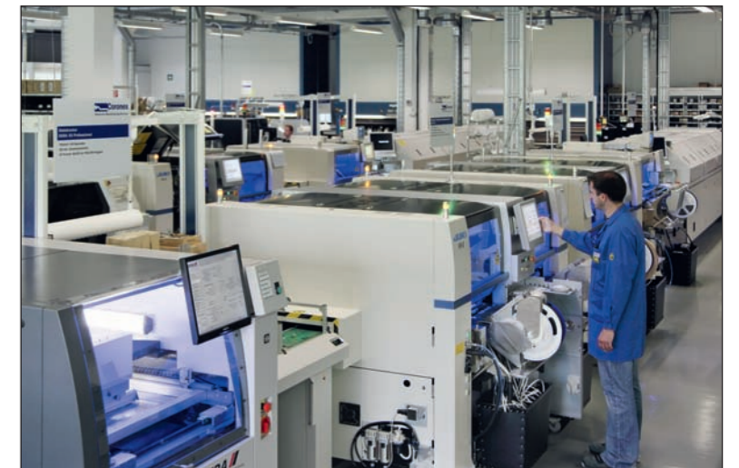
Modernisierung des Maschinenparks: neue SMD-Linien